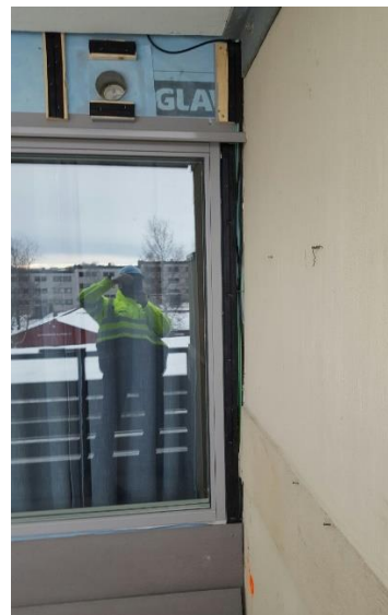
2. / 3. etasje

Mellom verandaveggen og stuevinduet føres det fram trekkør for fiberkabel. TV-kabel går ved siden av trekkørerne. Det er ikke lov for andelseieren å feste noe i dette området. Må du ha føringssskinne for screen ol. må du bruke braketter som festes i veranda- veggen.