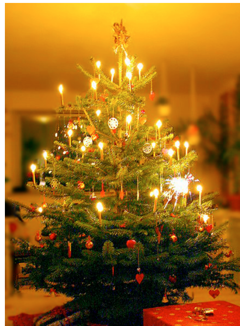
Gamle juletrær hentes tidlig morgen 11. januar.

Det er et stykke fram, men tida kommer når juletreet skal ut av stua. Du kan bli kvitt treet ved å sette det ved siden av søppelkonteinere senest fredag 10. januar . Renholdsverket samler inn trærne. Du kan gjerne ha jul i stua lengre enn dette, men da kaster du selv treet i den store konteineren ved Driftsgarasjen.